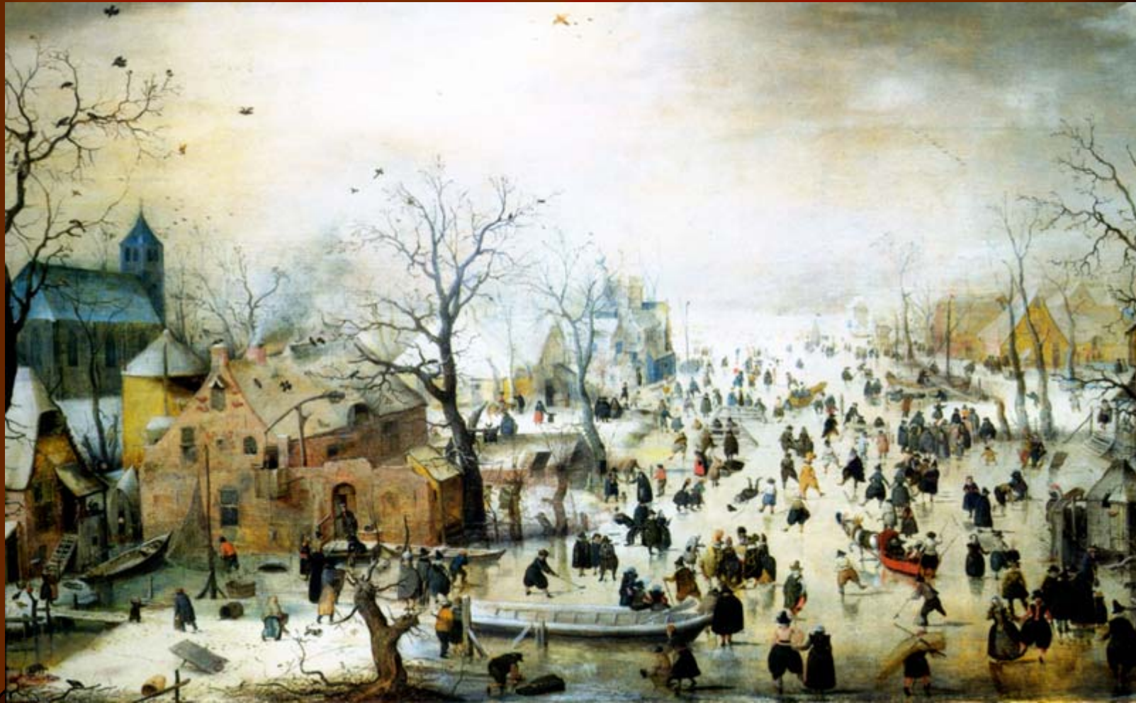
Hendrick Avercamp (1585-1634) Winter landscape with ice skaters