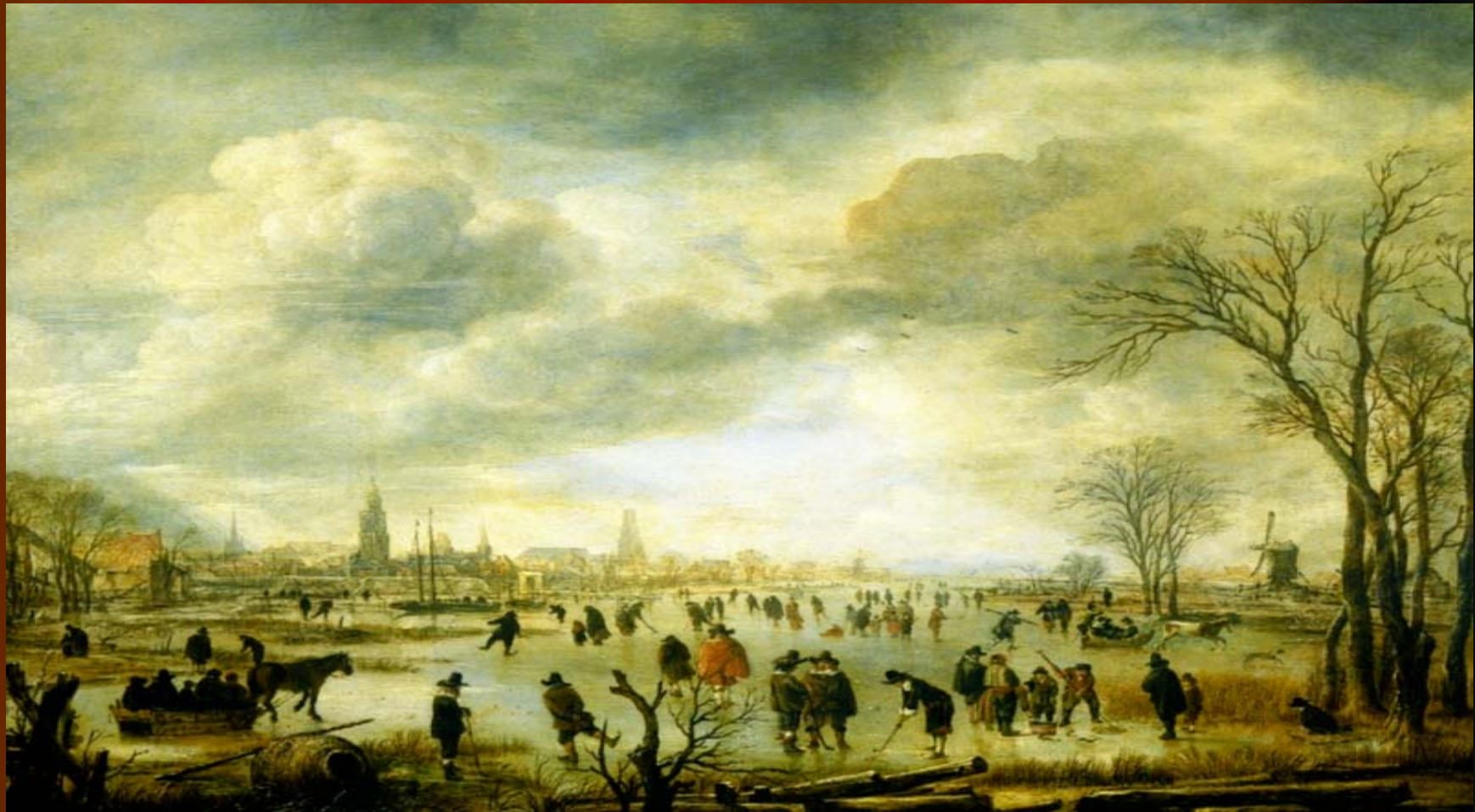
Aert van der Neer (1603-1677) River view in the winter